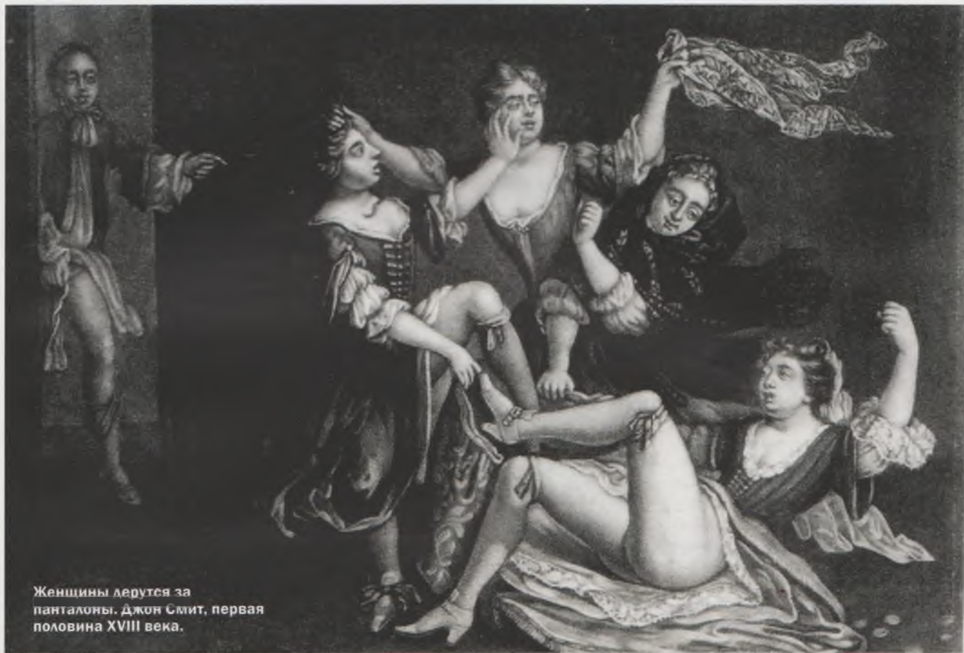
Женщины дерутся за панталоны. Джон Смит, первая половина XVIII века.

Женщина обладала ключом к чести семьи. Ее распутное поведение могло обесчестить семью, в то время как скромность хорошо отражалась на семейном союзе.