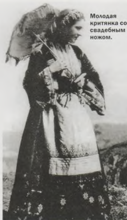
Молодая критянка со свадебным ножом.

Смешение слов honra (честь) и fama (репутация), то есть индивидуального и социального аспектов понятия чести, отчетливо проявляется в литературных произведениях периода золотого века Испании, где в качестве причины бесчестия фигурирует либо неверность женщины, либо посягательство на ее добродетель. В этом случае обесчещен-