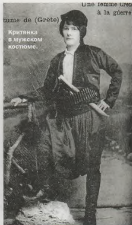
Une femme grecque à la guerre Критянка в мужском костюме.

ной являлась вся семья, все ее члены — не только муж, но и отец, брат, дядя. И все они имели равное право мстить. Случаи, когда женщины не желали, чтобы их личные обиды улаживали мужчины, встречались крайне редко.