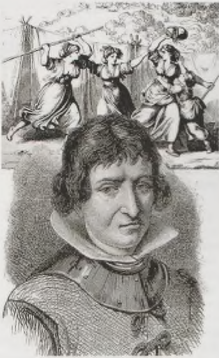
Каталина де Эраусо (1952-1650).

Насилие между женщинами всегда рассматривалось не как защита чести, а лишь как результат женской порочности и приверженности к проявлению страстей.