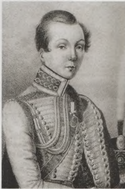
Кавалерист-девица Надежда Андреевна Дурова, она же — Александр Александров (1783-1866).

На многих портретах той эпохи можно увидеть женщин с ножами, подвешенными у пояса рядом с сумочкой. Еще в 1597 году в «Ромео и Джульетте» Шекспир устами одного из персонажей настаивал, что Джульетта должна «носить свои свадебные ножи». И на «Атласе Европы» Джона Спиды 1626 года можно увидеть англичанку, держащую в руках сумочку и ножи. Светских дам со свадебными ножами любил изобра-